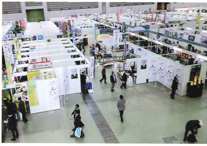
ビジネスマッチ東北2015の様子